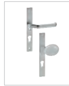
Klinke & Türknauf